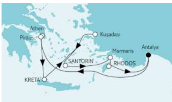
Dubai mit Muscat