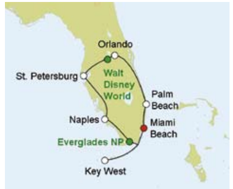
Selbstfahrerrundreise „Florida Deluxe“