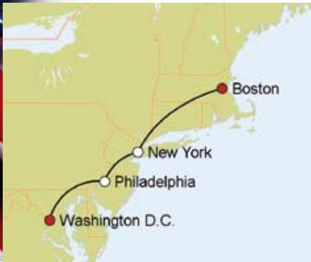
Selbstfahrerrundreise „Highlights der Ostküste“