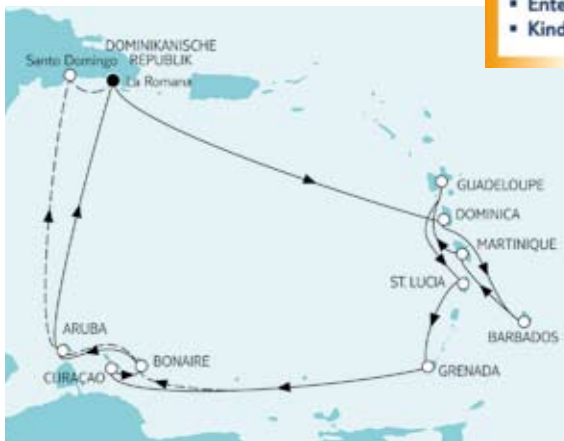
Karibik ab/bis Dom. Republik