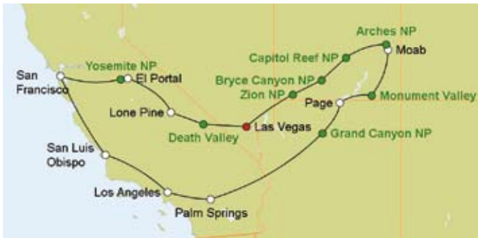
Selbstfahrerrundreise „Las Vegas und die Nationalparks“