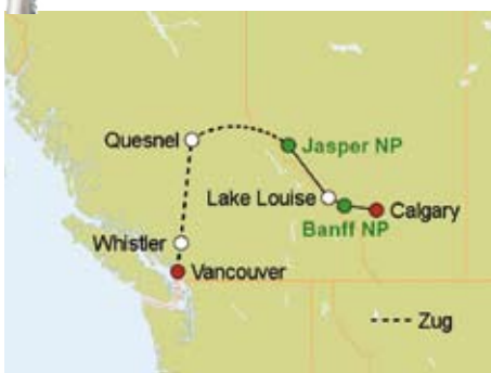
Zug- / Busreise „Northern Explorer“