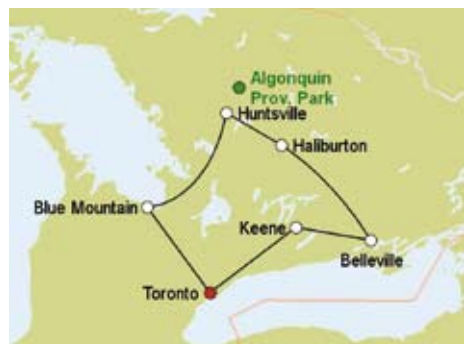
Selbstfahrerrundreise „Natürlich Ontario“