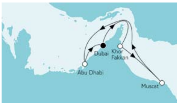
Östliches Mittelmeer mit Rhodos