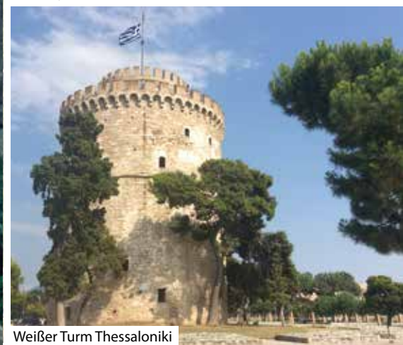
Weißer Turm Thessaloniki