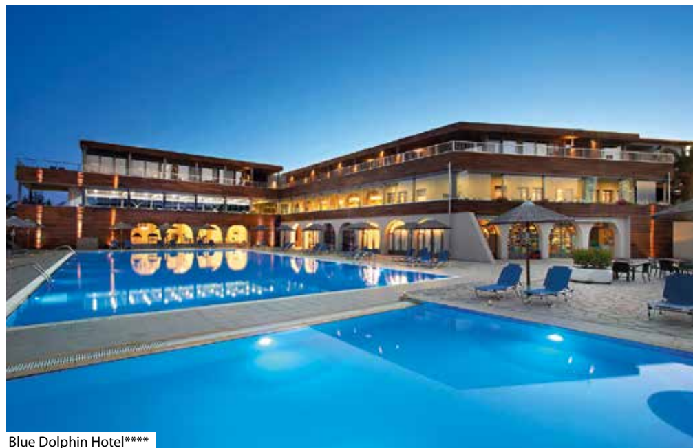
Blue Dolphin Hotel****