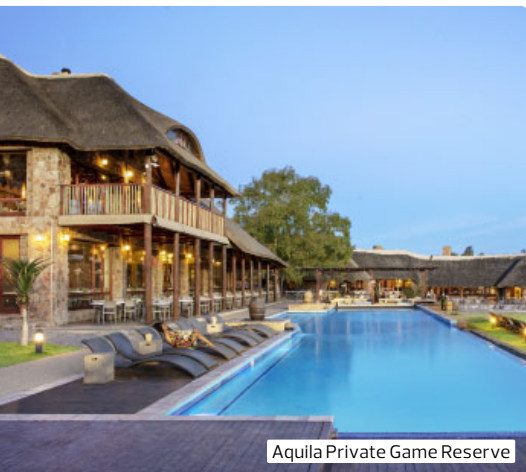
Aquila Private Game Reserve

Genießen Sie Landschaft und Kultur, Genuss und Design und Tiere & Wein in der Lifestylmetropole am Fuße des Tafelbergmassivs. Die quirlige „Mother City“ ist ein bunter Mix aller Nationen und Ausgangspunkt für unzählige Aktivitäten im Western Cape. Am Kap der Guten Hoffnung stehen Sie am schönsten Ende der Welt. Und wer das Buschabenteuer sucht, kann sich im Aquila Private Game Reserve auf „Big 5“ und Spurensuche begeben.