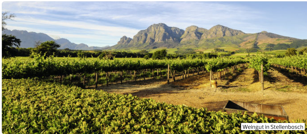
Weingut in Stellenbosch